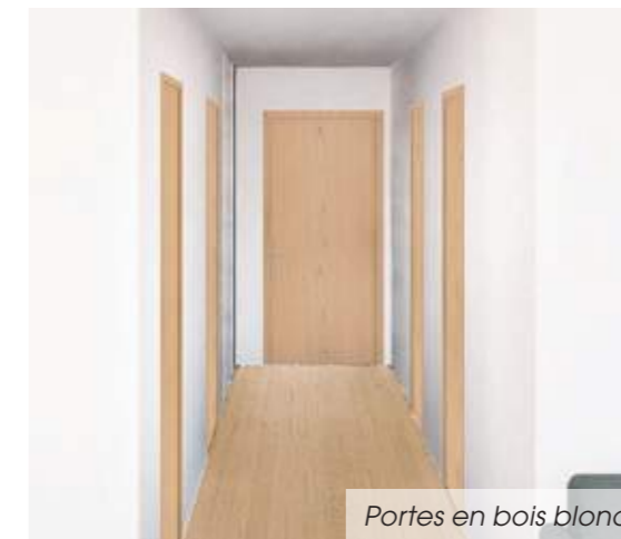
Portes en bois blond

Afin de sublimer les déplacements à l'intérieur des appartements, les résidents pourront magnifier les entrées avec des portes en bois blond .