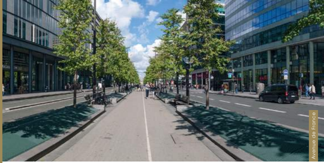
Avenue de France