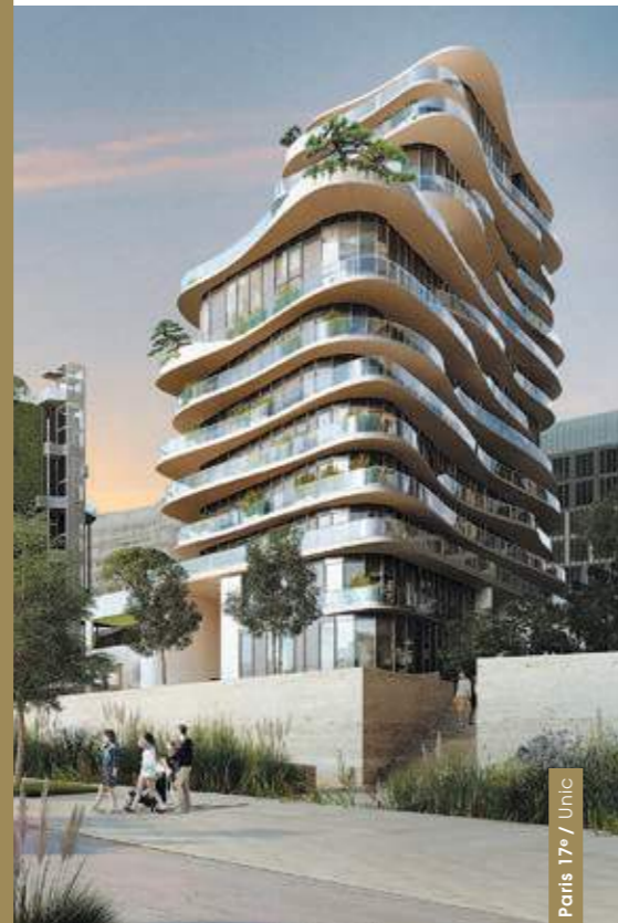
Paris 17 e / Unic