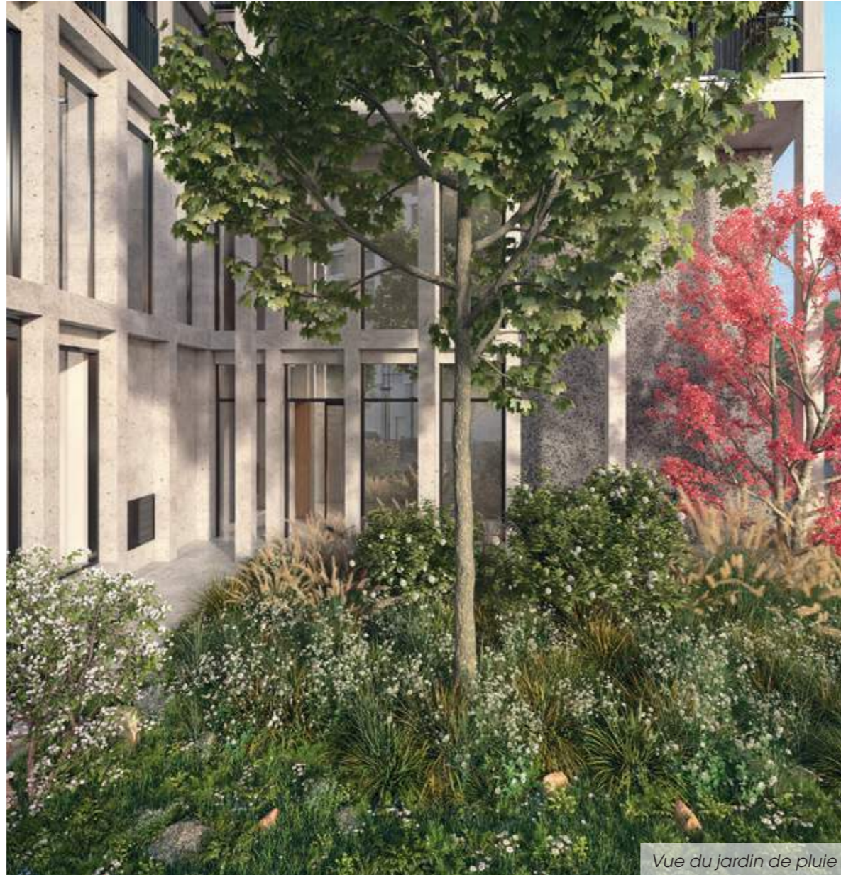
Vue du jardin de pluie