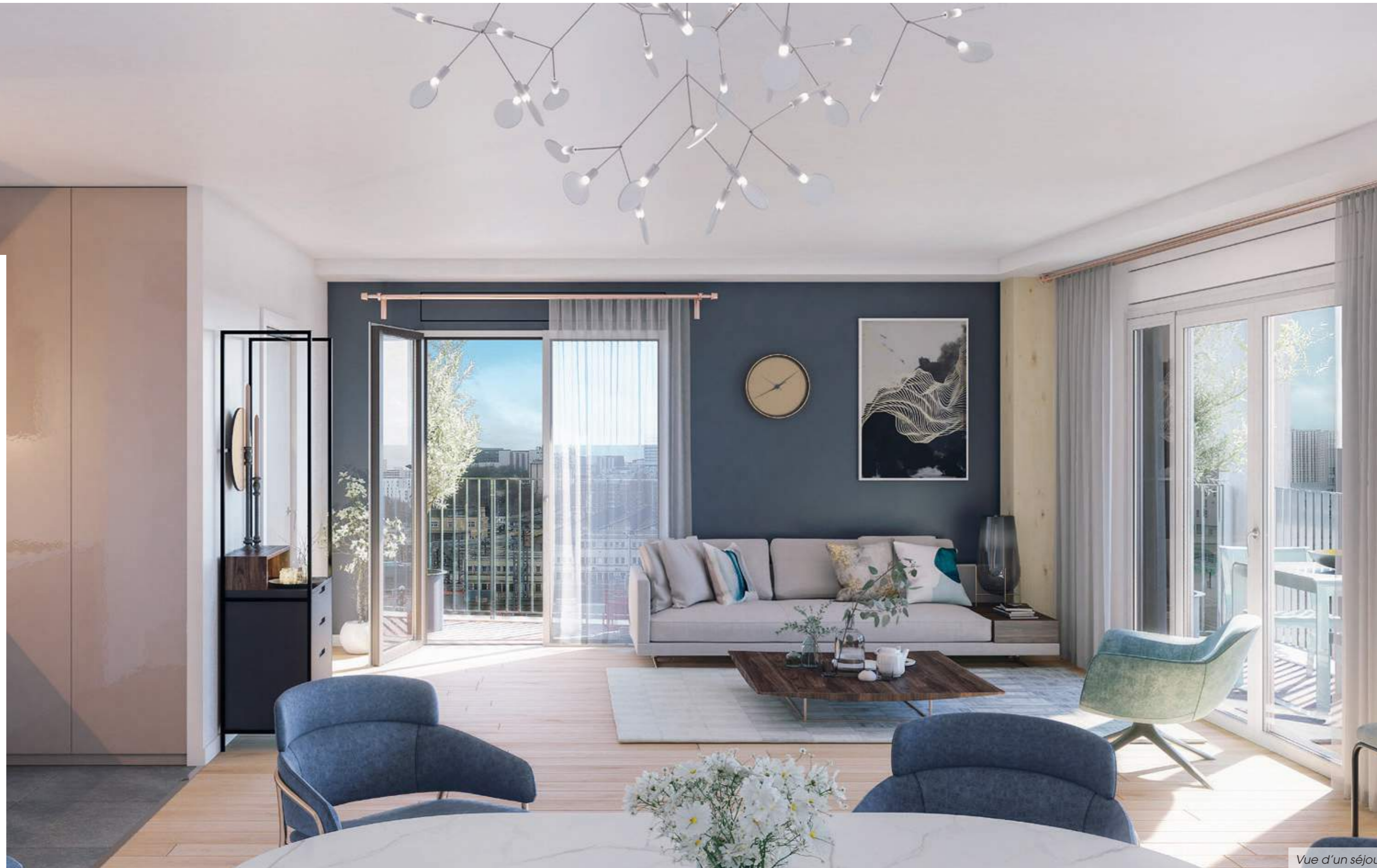
Vue d'un séjour

Contemporain, scandinave ou vintage, ce matériau noble se prête à toutes les décorations intérieures.