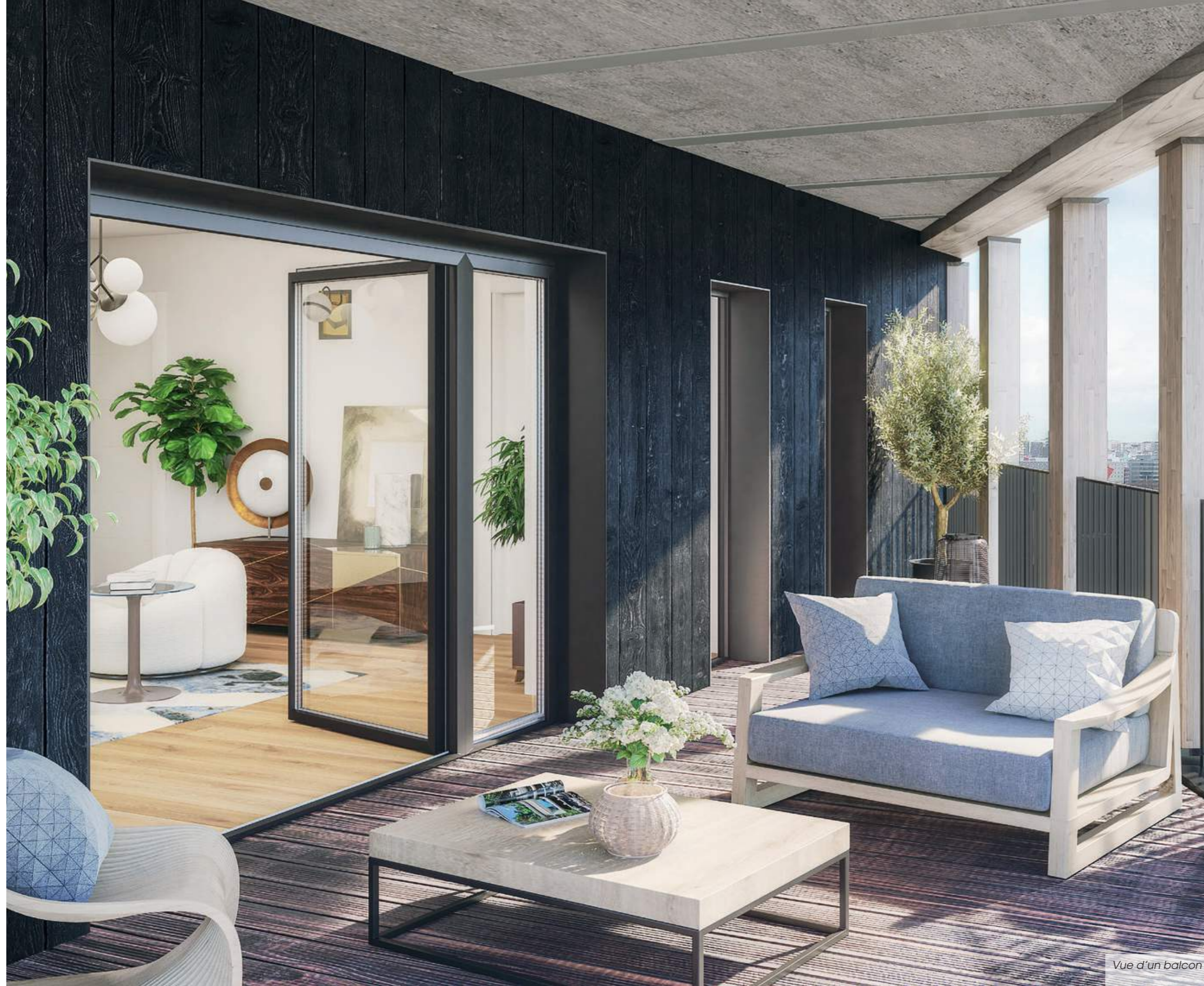
Vue d'un balcon