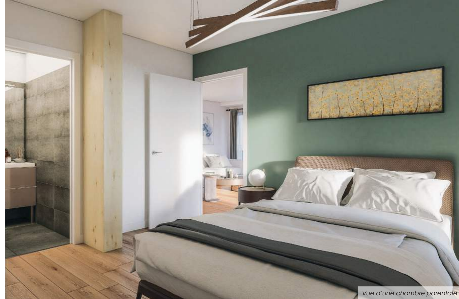
Vue d'une chambre parentale

Dans une démarche de développement durable exigeante, la résidence vise les certifications environnementales suivantes : NF Habitat, plan climat et plan biodiversité Ville de Paris, E+ C-