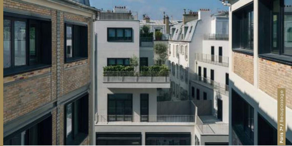
Paris 7 e / Beaupassage

Inspiré par le Grand Paris et ses défis, Emerige y réalise 45 résidences, dont à Paris « Passage Oberkampf » (11 e ), « Place Félix Eboué » et « 5 Rue Erard » (12 e ), « 7 Rue de Tolbiac » (13 e ) et « 23 Crimée » (19 e ). Après avoir inauguré Beaupassage en 2018, premier quartier dédié à l'art de vivre à Paris 7 e rassemblant des chefs et artisans dans un cadre architectural d'exception, il livrera cette année de nombreux autres projets résidentiels emblématiques parmi lesquels Unic , situé dans l'éco-quartier des Batignolles (Paris 17 e ) et conçu par les architectes MAD et Christian Biecher, Trilogie à Asnières-sur-Seine, conçu à la manière d'une œuvre de Land Art et lauréat du Grand Prix Régional des Pyramides d'Argent 2019, ou encore 26 Quai de l'Aisne à Pantin, réalisé par les architectes Chartier Dalix face au canal de l'Ourcq.