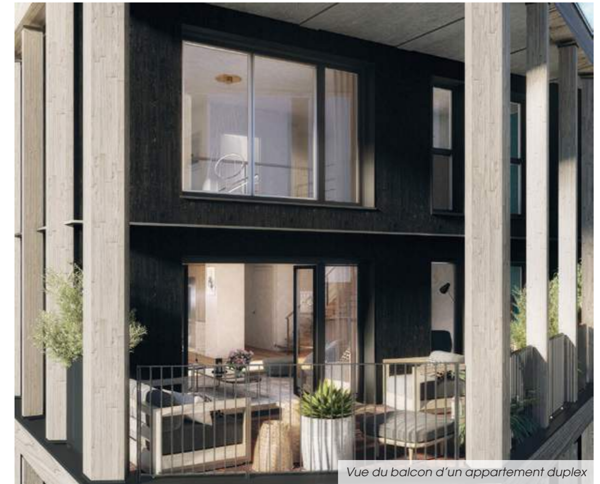
Vue du balcon d'un appartement duplex