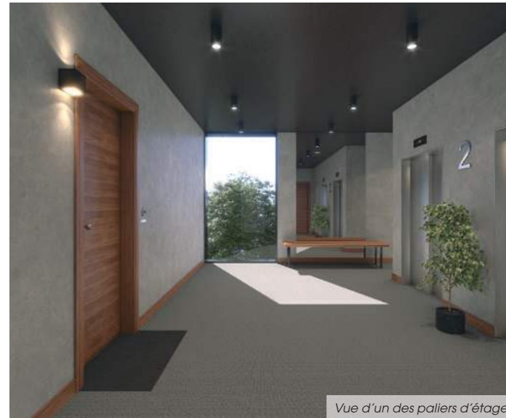
Vue d'un des palliers d'étage