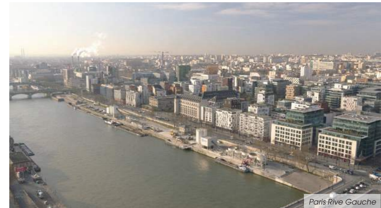
Paris Rive Gauche