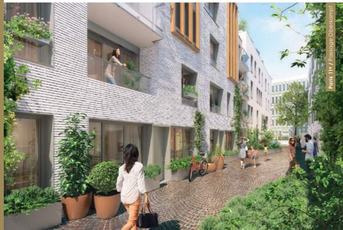
Paris 11 e / Passage Oberkampf