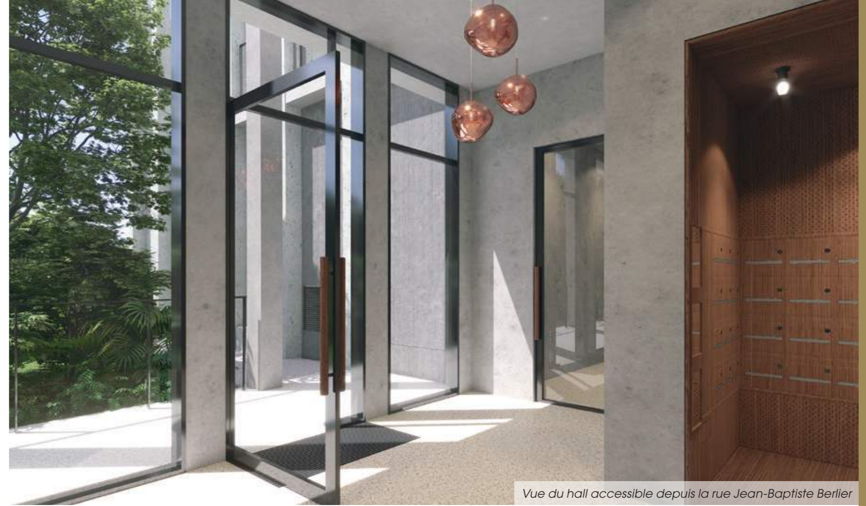
Vue du hall accessible depuis la rue Jean-Baptiste Berlier