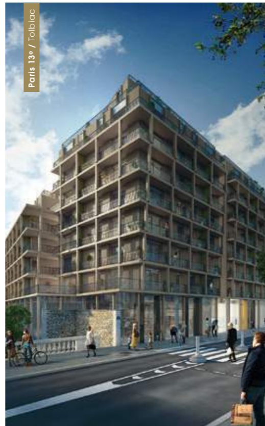
Paris 13 e / Tolbiac