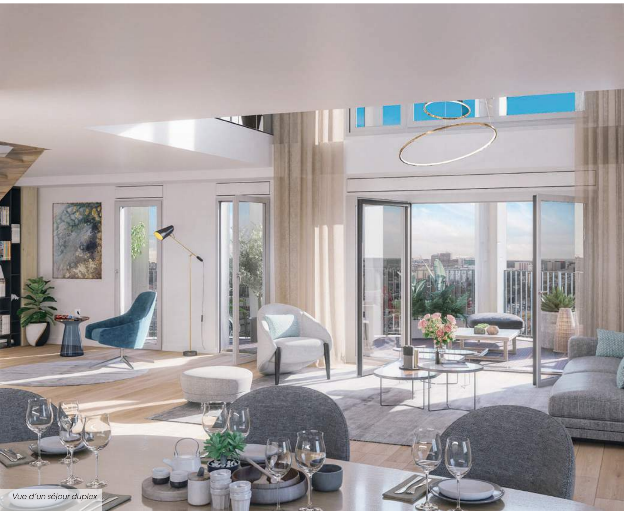
Vue d'un séjour duplex

Dans les duplex, les deux niveaux se retrouvent en pleine lumière au-dessus de la ville. Sous une majestueuse hauteur sous plafond, le salon cathédrale est magnifié par une disposition agréable à vivre au quotidien.