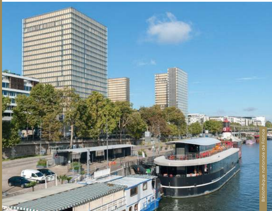
Bibliothèque nationale de France

Délimité par la Gare d'Austerlitz, la Seine et la rue du Chevaleret, Paris Rive Gauche est le plus grand projet de renouvellement urbain que la ville de Paris ait connu depuis plusieurs années.