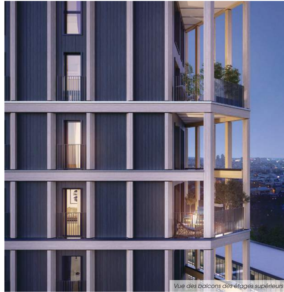
Vue des balcons des étages supérieurs