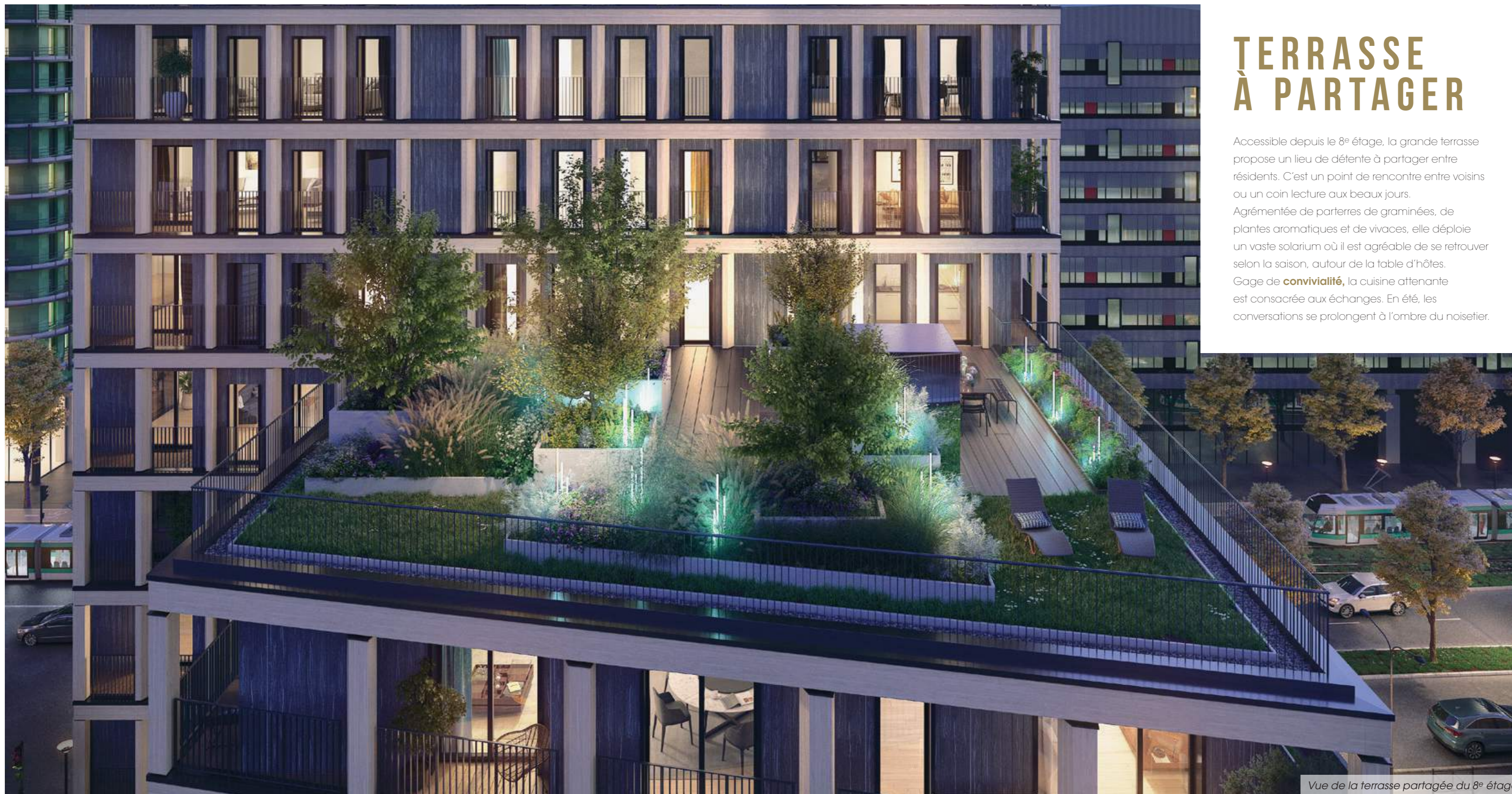
Vue de la terrasse partagée du 8 e étage