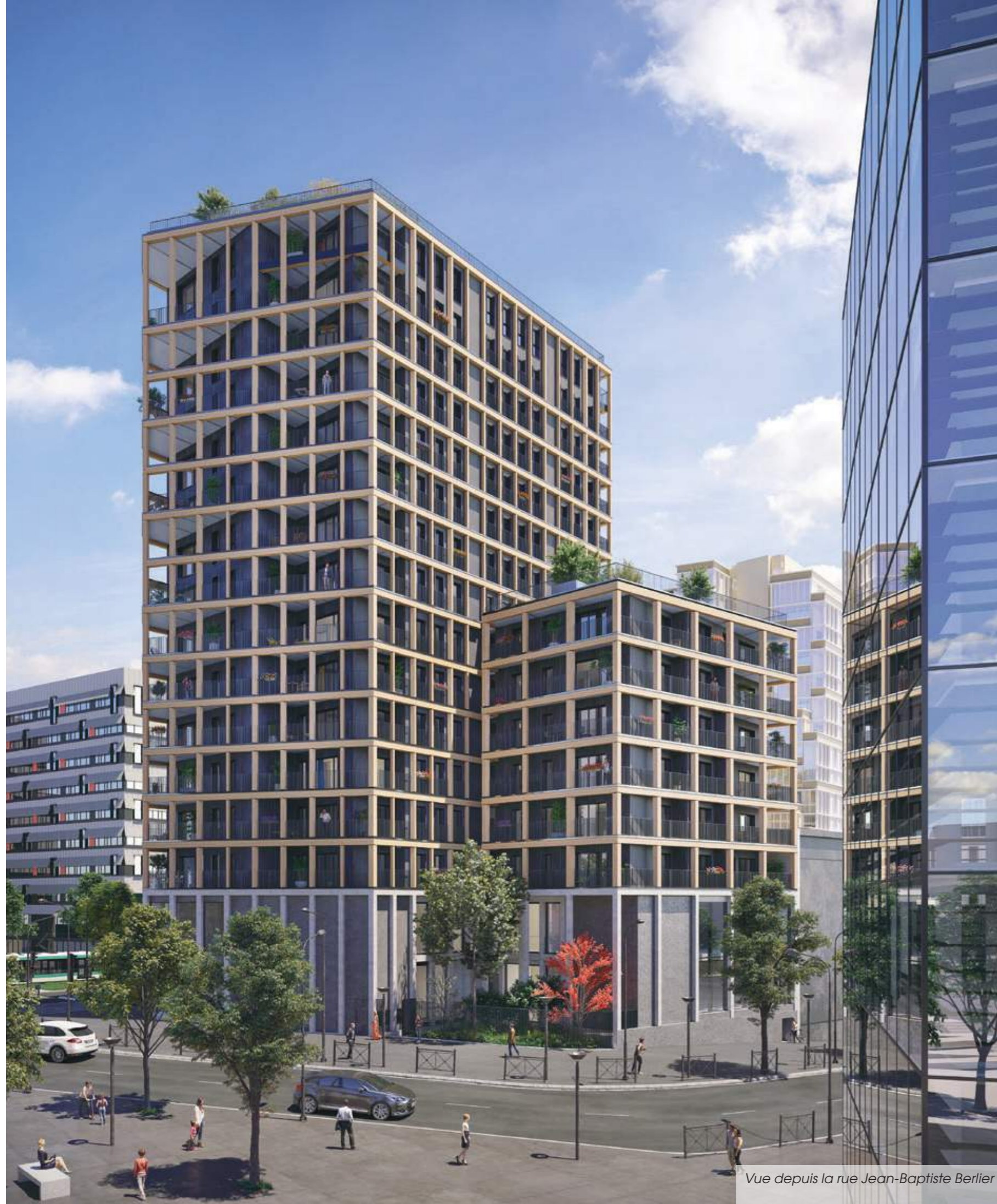
Vue depuis la rue Jean-Baptiste Berlier

L'échange entre Emerige et le cabinet d'architectes Moreau Kusunoki permet l'éloge du bois, une matière universellement répandue à la technicité des plus sophistiquées.