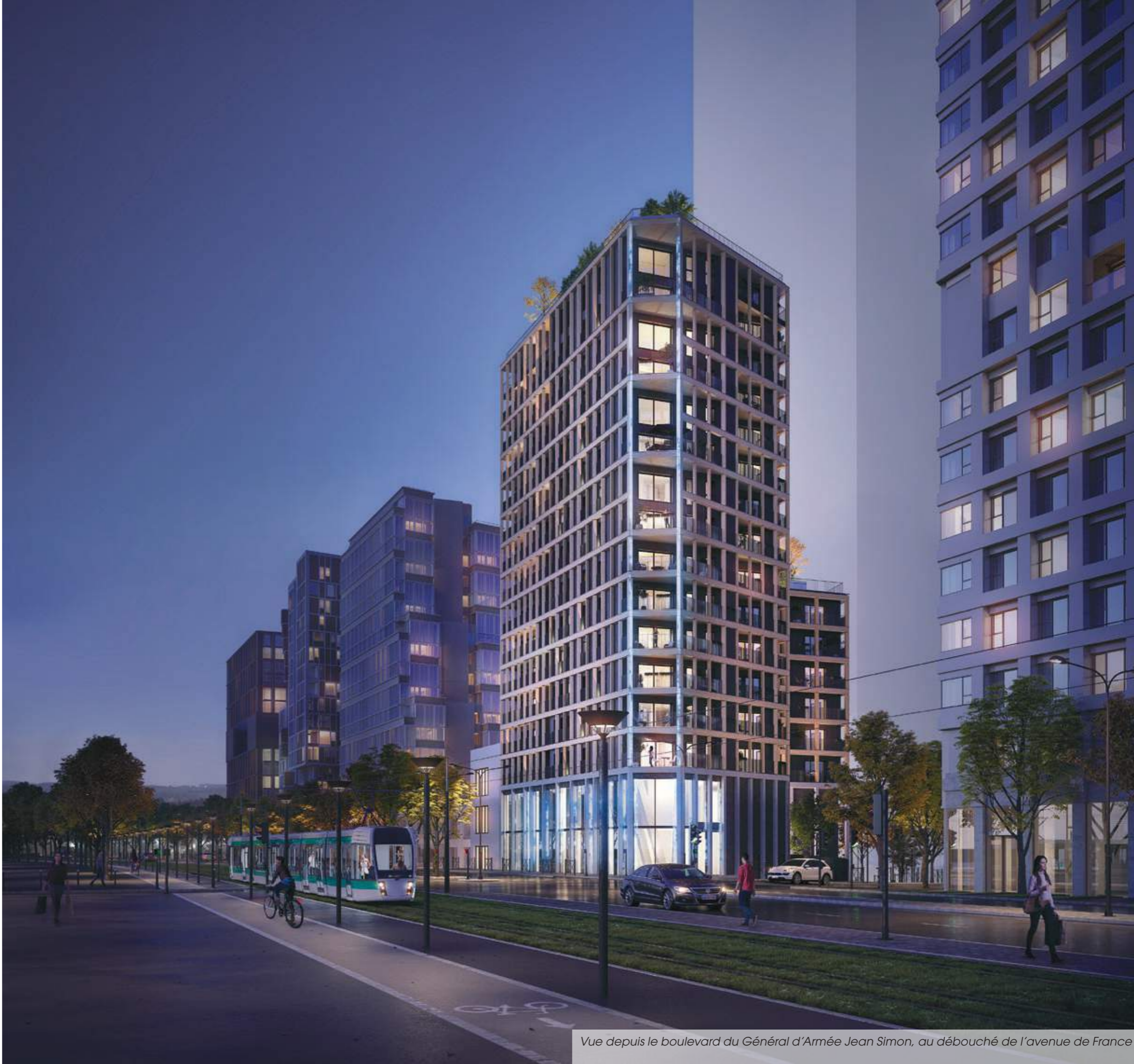
Vue depuis le boulevard du Général d'Armée Jean Simon, au débouché de l'avenue de France